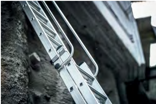
Abb. Bestell-Nr. 30296-30297 (Handlauf steckbar)