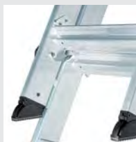
Beschläge zur Arretierung