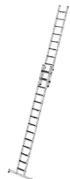
Abb. Bestell-Nr. 40679