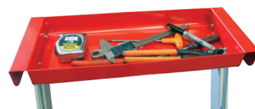
Praktische und stabile Ablageschale