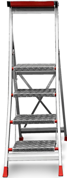
↑ 4 Stufen EN 14183