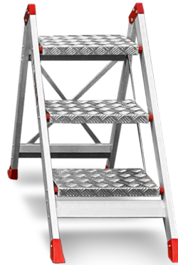
↑ 3 Stufen, ohne Werkzeugablage EN 14183