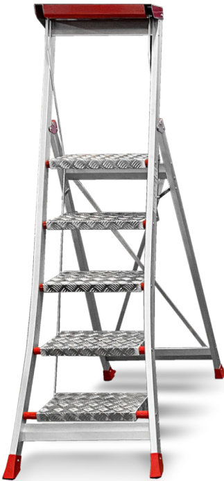
↑ 5 Stufen EN 131.1-2