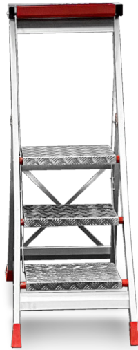
↑ 3 Stufen EN 14183