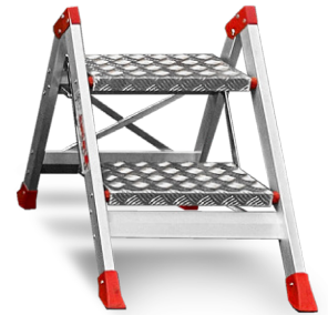
↑ 2 Stufen, ohne Werkzeugablage EN 14183