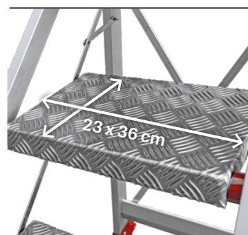
Rutschfeste Plattform 23x36 cm und ergonomische Stütze