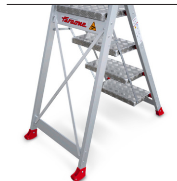
Breite, hoch belastbare Stufen bis 150kg