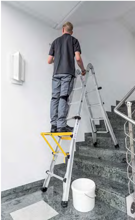
Abb. Bestell-Nr. 32015 und Bestell-Nr. 19900