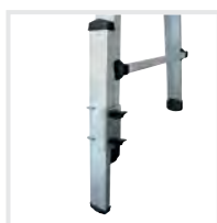
Holmverlängerung Bestell-Nr. 32021