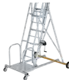
2 Lenkrollen inkl. Feststellbremse Ø 150 mm ableitfähig (Aufstieg) (Rollensatz gegen Mehrpreis elektr. ableitfähig # 301324 lieferbar)