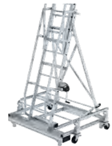
Absenkbares Zentralhebel-fahrwerk 4 Lenkrollen Ø 150 mm