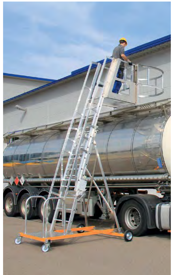
Abb. Bestell-Nr. 301304 und Bestell-Nr. 301306

Hinweis: Die Tankwagenleiter dient ausschließlich als Zugang für Bedienungs- bzw. Kontrollarbeiten im Be- und Entladevorgang.