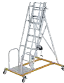
4 Lenkrollen Ø 150 mm

Hinweis: Die Tankwagenleiter dient ausschließlich als Zugang für Bedienungs- bzw. Kontrollarbeiten im Be- und Entladevorgang.