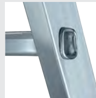
4-fach gebördelte Sprossen- / Holmverbindung