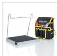
Sicherer Stand Bestell-Nr. 19324

Neben Sets für einen sicheren Stand, gibt es auch Pakete mit praktischen Helfern oder zur Erfüllung der TRBS.