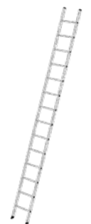
Abb. Bestell-Nr. 10014