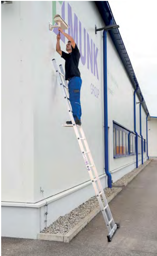
Abb. Bestell-Nr. 10112 und Bestell-Nr. 19910