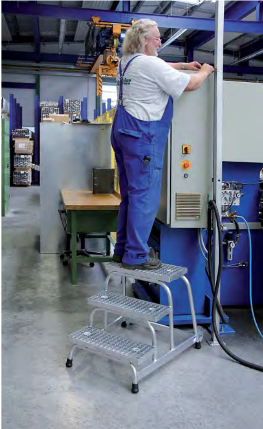
Abb. Bestell-Nr. 51019