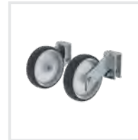
Hubrollen Bestell-Nr. 50041