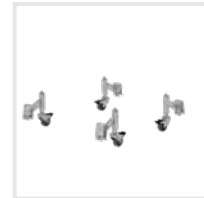
Feder-Bremsrollen Bestell-Nr. 50036