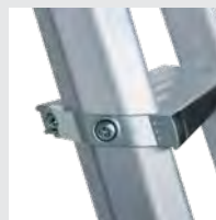
Hochfest verschraubte Stufen-/ Holmverbindung