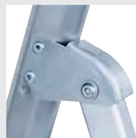
4-fach genietetes Leitergelenk