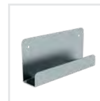
Leiterwandhalter L Bestell-Nr. 19839