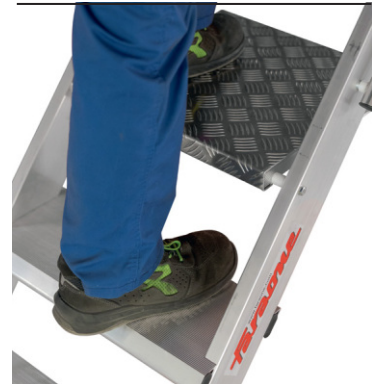
18 cm tiefe, rutschfeste Stufen