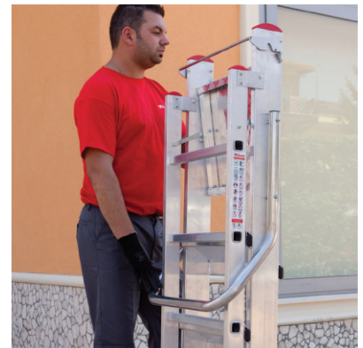
Robuster, klappbarer Sicherheitsbügel mit automatischer Sicherheitsverriegelung