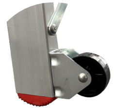
Komfortables Verfahren durch die Hinterräder