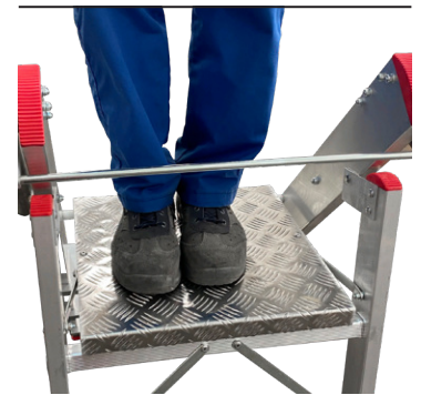
Sichere Arbeitsplattform 40x40 cm