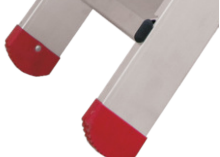
Leiterschuh 100 mm