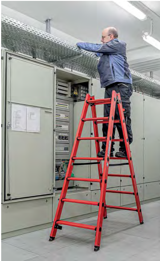
Abb. Bestell-Nr. 34214