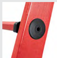
Hochfeste Stufen- / Holmverbindung