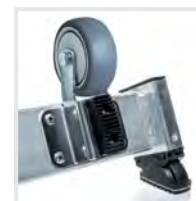
Nachrüstsatz "roll-fix" Bestell-Nr. 19638