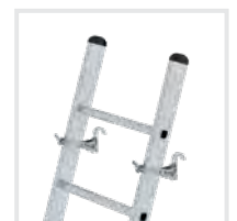
Leiterkopfsicherung Bestell-Nr. 19315, 19316, 19317