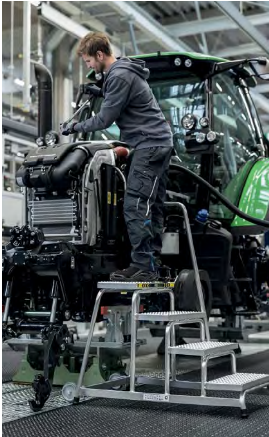
Abb. Bestell-Nr. 51037