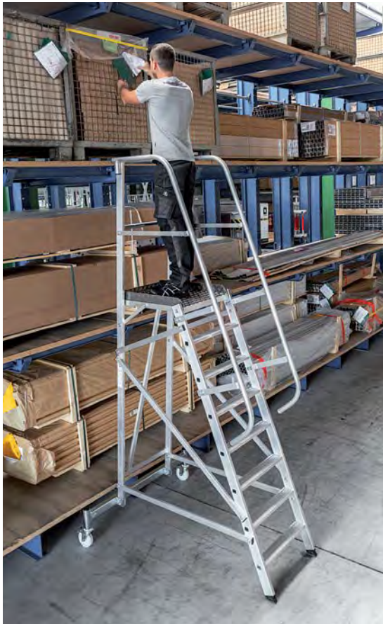
Abb. Bestell-Nr. 52508