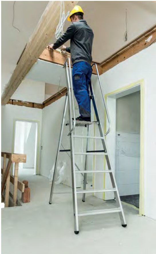
Abb. Bestell-Nr. 51096