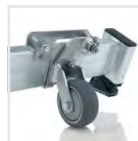
Nachrüstset 'roll-bar' Bestell-Nr. 19634