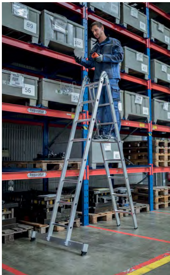
Abb. Bestell-Nr. 32216 und Bestell-Nr. 19910