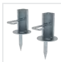
Erdschrauben Bestell-Nr. 19939