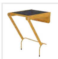
Einhängepodest R 13 Bestell-Nr. 19900