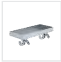
Ablageschale Bestell-Nr. 19274 - 19276