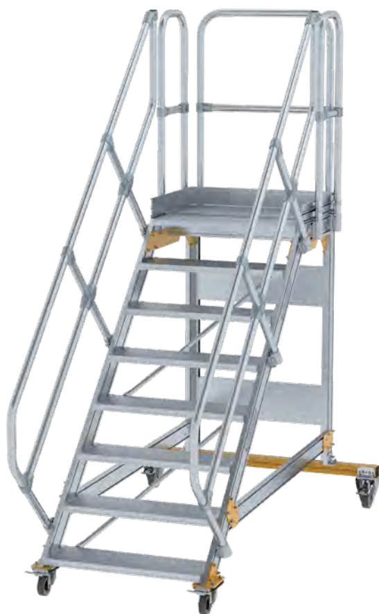
Abb. Bestell-Nr. 600788