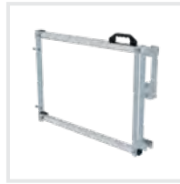
Sicherungs- schranke Bestell-Nr. 690746 - 690748