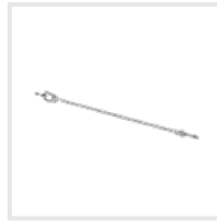
Sicherungsseil Bestell-Nr. 70738 - 70740