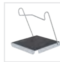
Einhängtritt R 13 Bestell-Nr. 19910