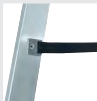
Spreizsicherung mit zwei hochfesten Polyestergurten