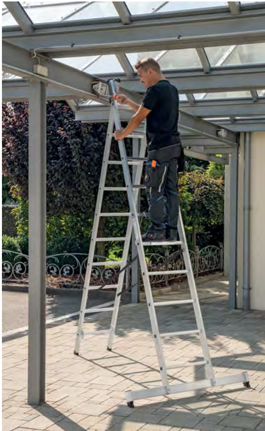
Abb. Bestell-Nr. 31220 und Bestell-Nr. 19910