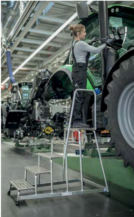
Abb. Bestell-Nr. 50045